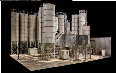
Captations réalisées avec un scanner 3D